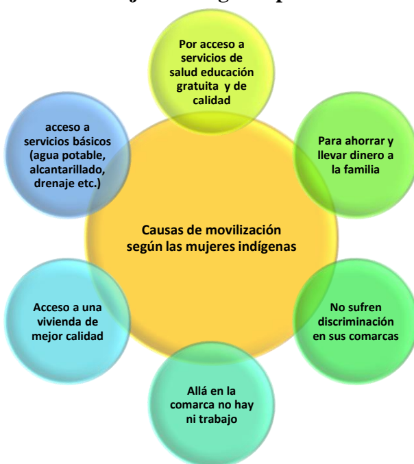
Ilustración 1 Representación gráfica de las principales causas de la movilidad, desde la perspectiva de las mujeres indígenas panameñas